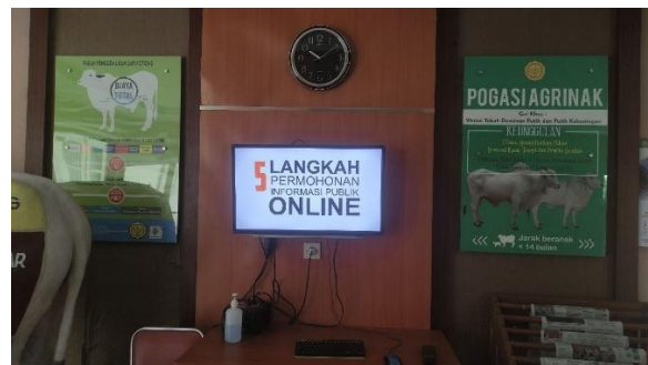
Ruang Pelayanan Informasi